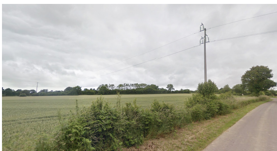
1a- Emplacement du poste et le pylône existant vus depuis le CR n°6