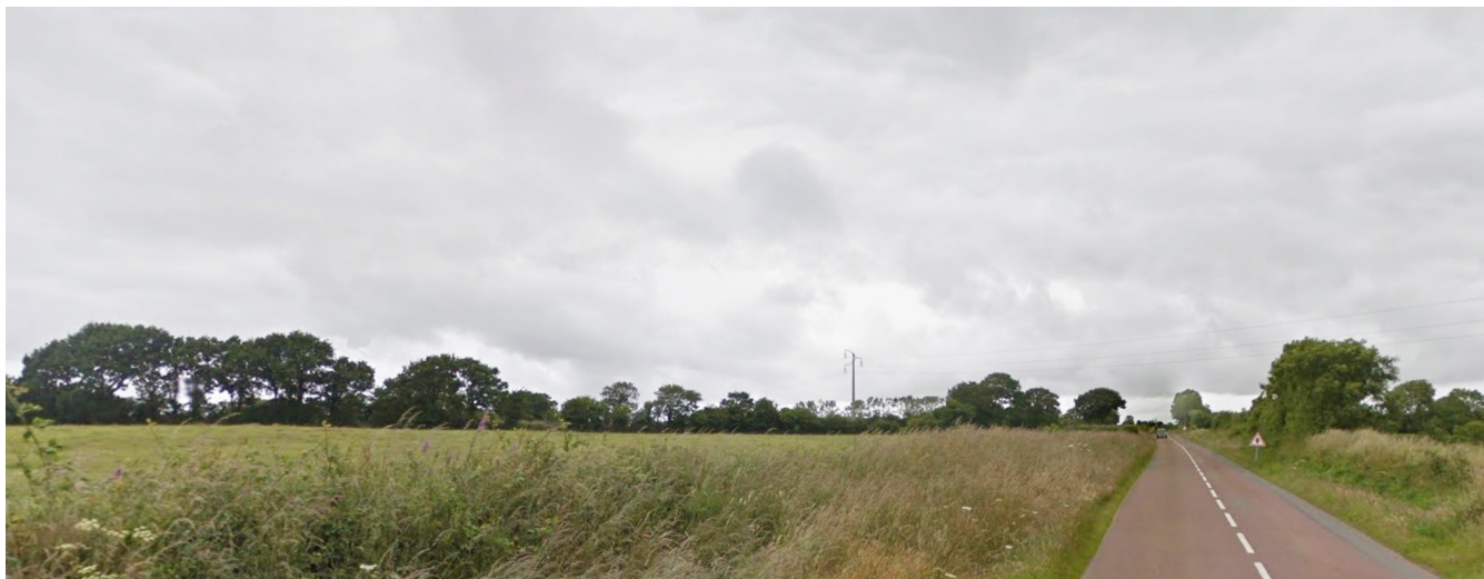
2- Depuis la D 68