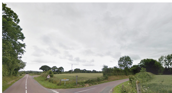
1b- Emplacement du poste vu au carrefour de la D274 et de la D68